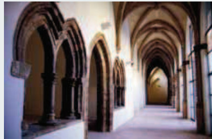
Claustro de Santa María.

Seguimos caminando por la calle Herrer y Marco, hasta llegar a la pza. de Santa María, donde nos encontramos con una de las principales joyas del patrimonio bilbilitano, la Real Colegiata de Santa María la Mayor , 3 que fue construida sobre la antigua mezquita de la ciudad, por Alfonso I. Era considerada parroquia Mayor e iglesia de la nobleza. De la