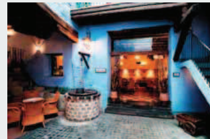
Mesón de la Dolores

Una vez vista la Colegiata, salimos por la calle Sancho y Gil llegamos a la calle Mesones, y llegaremos al famoso Mesón de La Dolores , 10 de tres estrellas, forma parte de la Red de Hospederías de Aragón. En él podemos visitar un museo específico sobre el famoso personaje y una bodega medieval dedicada a Centro de Interpretación de los vinos de la Denominación de Origen de Calatayud .