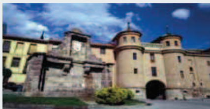
Fuente de los ocho caños y puerta de Terrer.

Durante años fue también utilizada para la realización de los espectáculos taurinos.