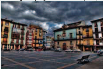
Plaza de España

Bajando por la calle Gotor, podemos contemplar la fachada de dos palacios renacentistas de estilo aragonés y llegar a la Pza. de España , 6