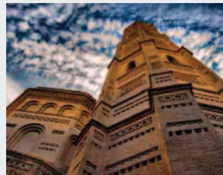
Torre de Santa María

Salimos de la iglesia, giramos hacia la izquierda, por la calle Amparados, y entramos