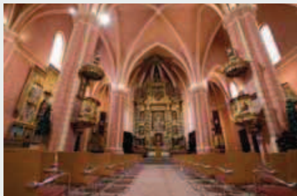
Interior San Pedro de los Francos

la estructura mudéjar de tres naves con altos pilares y bóvedas de crucería y triple ábside, con portada gótica.