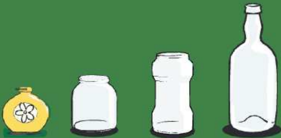
Botellas de vidrio, frascos y tarros