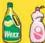
Productos de limpieza