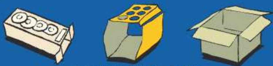
Envases y cajas de cartón