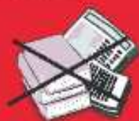
Libros y diarios