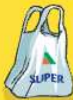
Bolsas de plástico de comercio