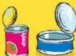
Latas de conserva