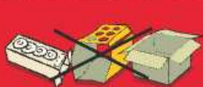
Envases y cajas de cartón