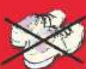
Calzado y ropa