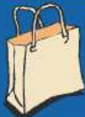
Periódicos, libros, revistas y bolsas de papel