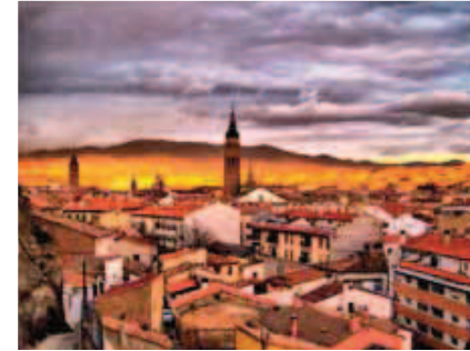
Vista panorámica desde la Virgen de la Peña